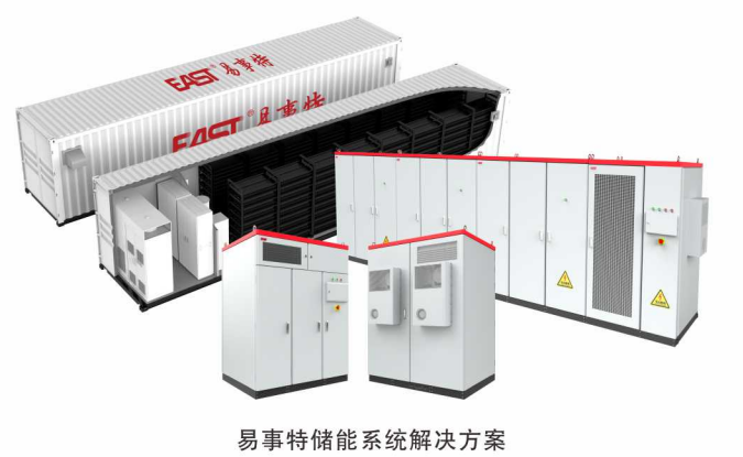
易事特储能系统解决方案

续深耕智慧能源等领域, 在光伏发电、储能、空气能、充换电等方面形成了核心竞争优势, 始终走在行业发展前列, 连续第7年上榜全球新能源500强。近两年, 集团还联合多所高等院校、科研院所, 共同发力钠离子电池储能等研发创新, 取得了积极进展和重要突破。新疆兵团承担着国家赋予的屯垦戍边职责及经济建设任务, 在强投资、兴产业、调结构、活政策等方面建树辉煌, 绿色循环经济发展势头强劲, 风电、光伏、储能、空气能、充换电等新能源产业大有可为。希望双方能在现有合作基础上, 进一步深化合作关系, 充分利用各自资源, 以新能源产业助力区域经济, 在创造经济价值的同时创造社会价值, 实现更广泛、更深层次的共创多赢。