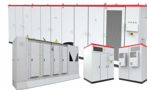
储能系统解决方案

领域不断突破，提升自身核心竞争力，并携手更多优秀企业，共同做强做大“绿电+储能”产业，加速区域经济升级步伐，助力我国经济社会高质量发展和伟大复兴中国梦早日实现！