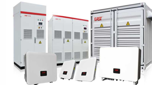
光伏系统解决方案