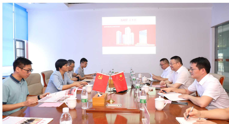
近日,《中共中央 国务院关于促进民营经济发展壮大的意见》发布,支持民营企业参与推进碳达峰碳中和,提供减碳技术和