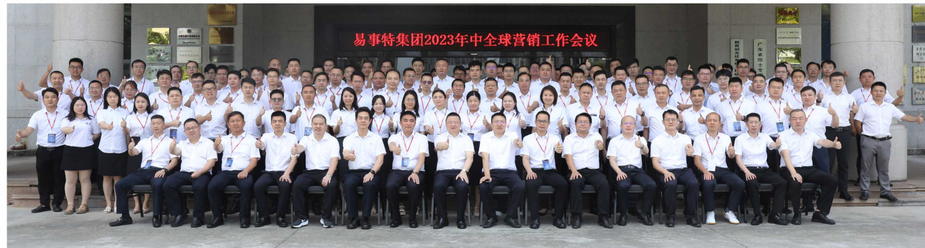
易事特集团2023年中全球营销工作会议