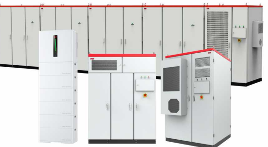
易事特部分储能系统解决方案

利18项、外观设计专利3项、软件著作权6项。同时,新品开发力度与速度不断加强,1500V1000V Intel Li智能组串式、集中式全场景储能产品系列及解决方案等相继投产,并迅速得到市场认可,销售比例逐年增加。形成成熟的储能系统商业化发展方案,在发电侧,可提供光伏电站、风电场增储和火储联合调频系统解决方案;在电网侧,可提供变电站、台区等储能系统解决方案;在用户侧,可为工商业、充电站、缺电少电等场景提供光储充一体化、移动式储充等系统解决方案,并广泛应用于广东、江苏、浙江、甘肃、青海、宁夏等多地市场,取得了良好的经济社会效益,为持续高质量发展奠定了坚实基础。